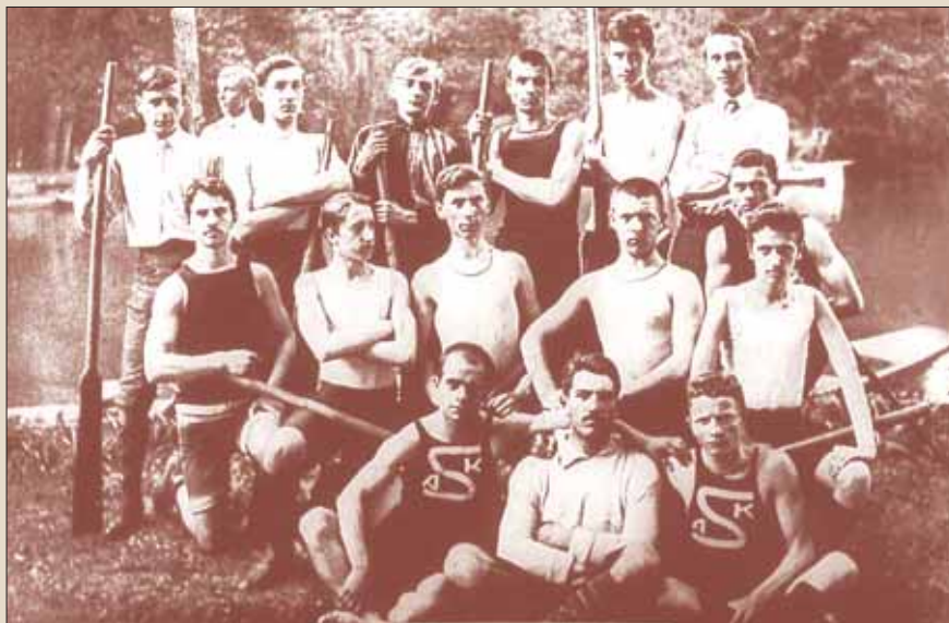
Članovi HAŠK-a na jezeru u Maksimiru 1903. godine

Međutim, sve brojnije športske organizacije koje se osnivaju u Hrvatskoj nisu mogle biti zadovoljne takvim rješenjima. Klubovima udaljenim od većih gradova središnji športski savez nije bio potreban samo zbog me-